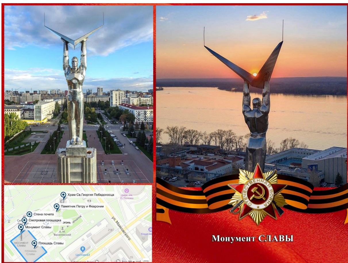
Фото: Монумент Славы

Известное и любимое место в Самаре как горожанами, так и гостями города — Самарская площадь и площадь Славы . Здесь установлен мемориальный комплекс, посвященный трудовым и военным подвигам жителей Самары. Со смотровой площадки площади Славы открывается великолепный вид на волжские просторы и Жигулевские горы.