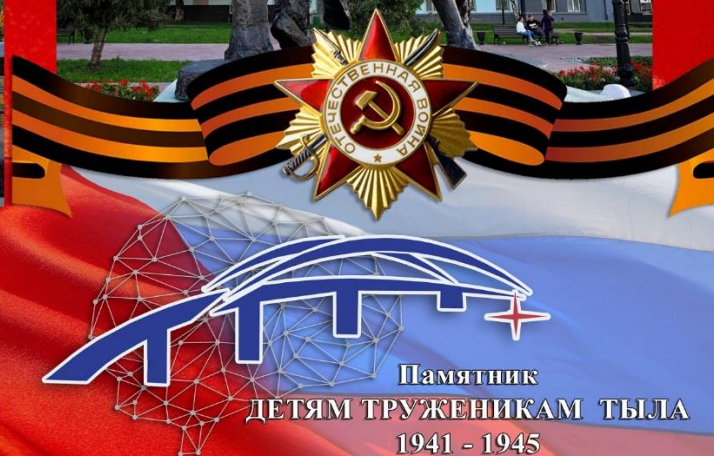
Фото: «Детям труженикам тыла»