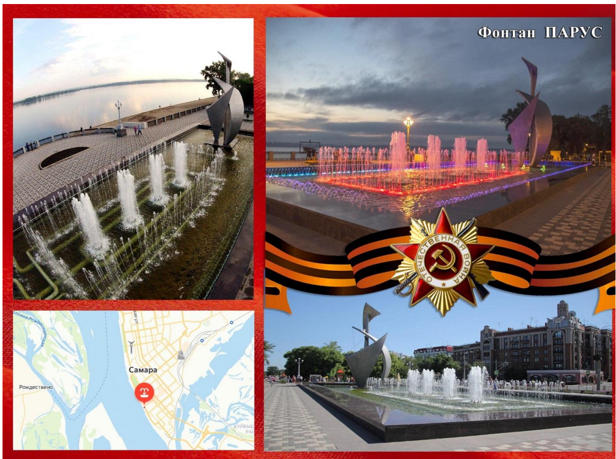
Фото: Фонтан «Парус»

Самолёт - штурмовик "Ил-2", построенный в г. Куйбышеве на авиационном заводе № 18, сбитый во время войны немцами, найденный осенью 1970 года в болотах Мурманской области.