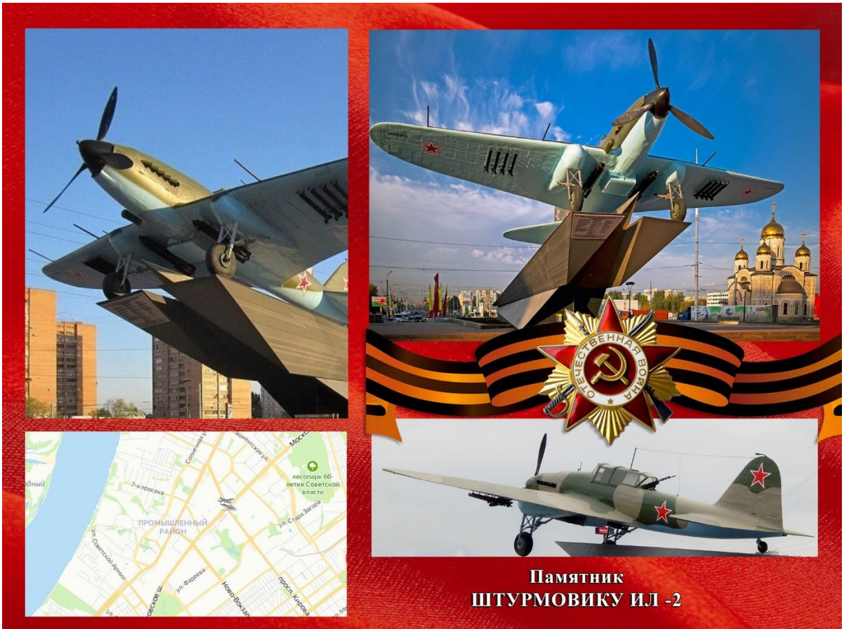
Фото: Самолёт - штурмовик Ил - 2

Памятник Санфировой Ольге Александровне - командиру эскадрильи 46-го гвардейского ночного бомбардировочного авиационного полка, прозванного фашистами "Ночные Ведьмы".