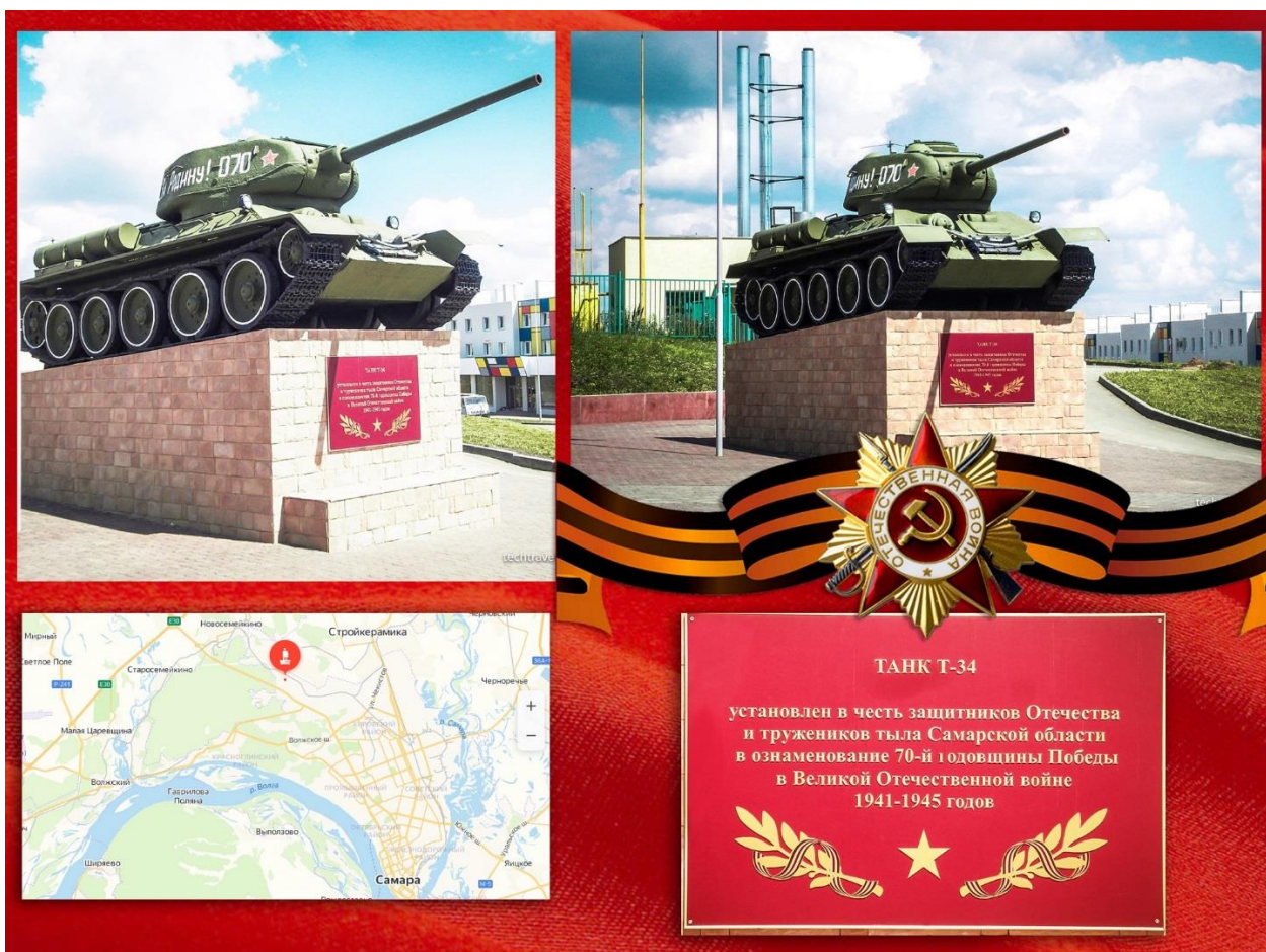
Фото. Монумент танк Т - 34

В микрорайоне «Крутые ключи» на постаменте был установлен знаменитый советский средний танк Т-34-85. Открытие монумента было приурочено ко Дню Героя, который отмечается в России 9 декабря.