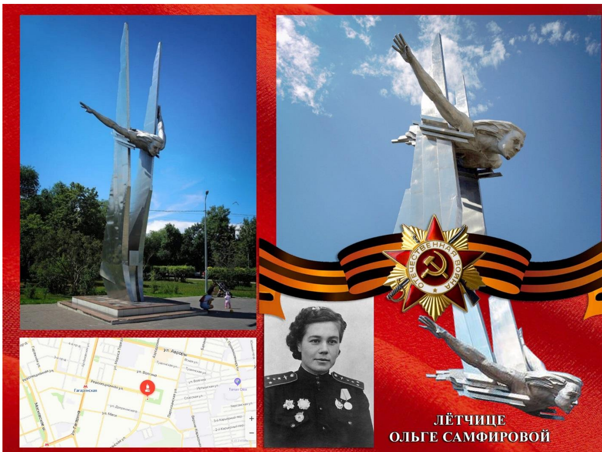
Фото: Памятник Лётчице Сафроновой

Стела посвящена заслуженной землячке, летчице. Командиру эскадрильи, Герою Советского союза, которая пала смертью храбрых на территории Польши в 1944 году. Памятник был торжественно открыт в 1985 году. Монумент расположен в сквере, недалеко от городского дома молодежи, на пересечении двух улиц – Аэродромной и Революционной. Авторы – скульптор А. С. Головин и архитектор Ю. И. Мусатов.