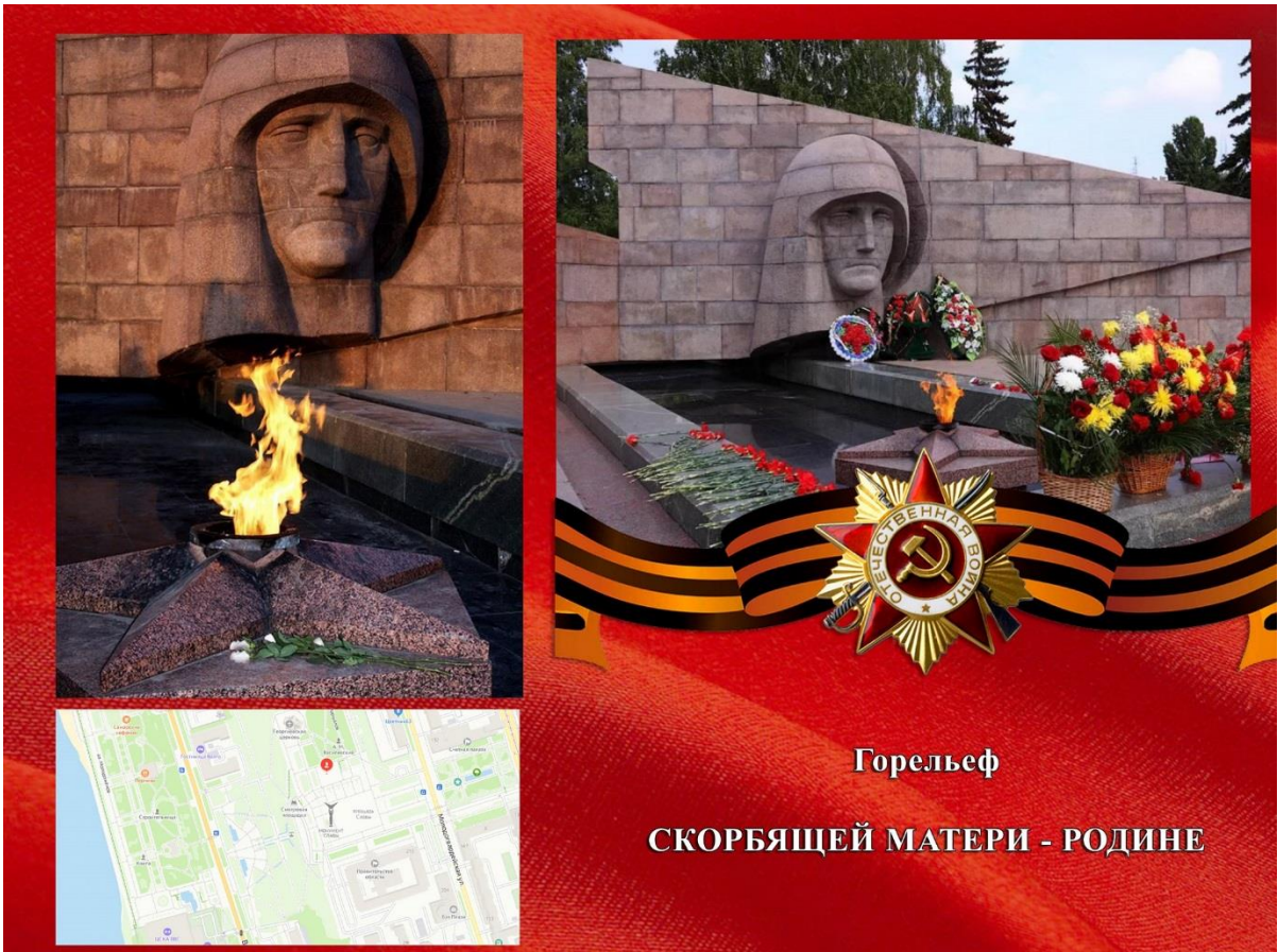
Фото: горельеф «Скорбящей Матери - Родины»

Вечный огонь и горельеф «Скорбящей Матери-Родине» установлен на площади Славы. Мемориал олицетворяет безутешную Родину-мать. Прямо перед памятным комплексом установлен Вечный Огонь который зажгли в 1971 году.