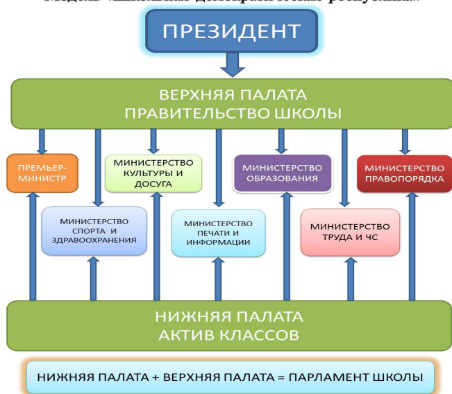
Структура ученического самоуправления Модель «Школьная демократическая республика»

Воспитательный компонент «ученическое самоуправление» реализуется следующим образом: